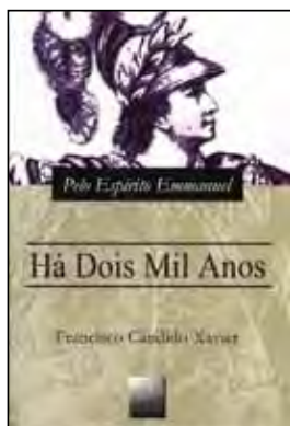
Há Dois Mil Anos Francisco Cândido Xavier (pelo espírito Emmanuel)

A humildade do Espírito Emmanuel nos proporciona esta narrativa da existência física em que foi o orgulhoso senador romano Públio Lentulus e obteve designação para alto