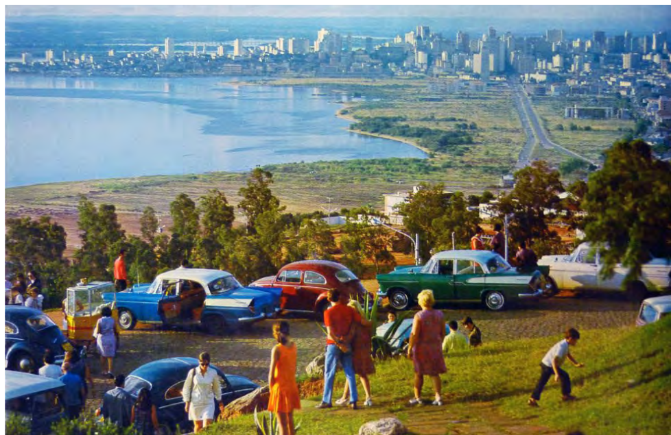
Foto da década de '60, ainda sem o Estádio Beira-Rio, inaugurado em 6 de abril de 1969.