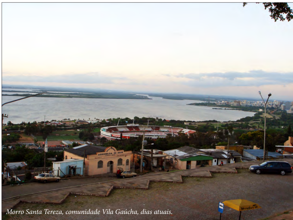
Morro Santa Tereza, comunidade Vila Gaúcha, dias atuais.

Este jornalzinho foi idealizado e elaborado pela turma de alunos de informática da União Espírita, durante o segundo semestre de 2011.